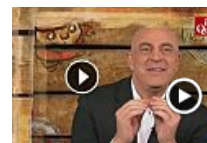
Crozza a Meloni: "A Bologna eravate in 100mila? 23 persone in un metro..."