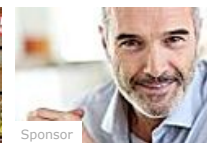
5 Segreti nascosti dalle banche (iFOREX)