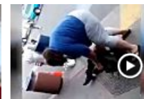
Usa, aggressione in strada ma la ladra non sa con chi ha a che fare: la...